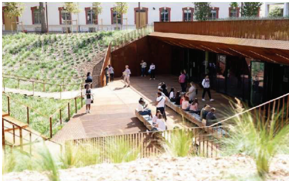
Pascal Levy, première pré-rentree sur le nouveau campus Port Royal, 3 Septembre 2019, Photothèque paris 1